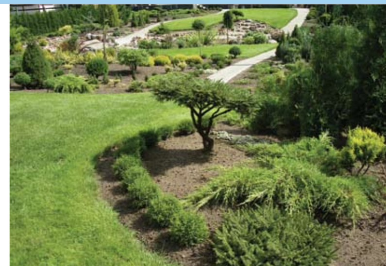
Neperformuotas reljefas padeda sukurti išskirtinę individualią aplinką