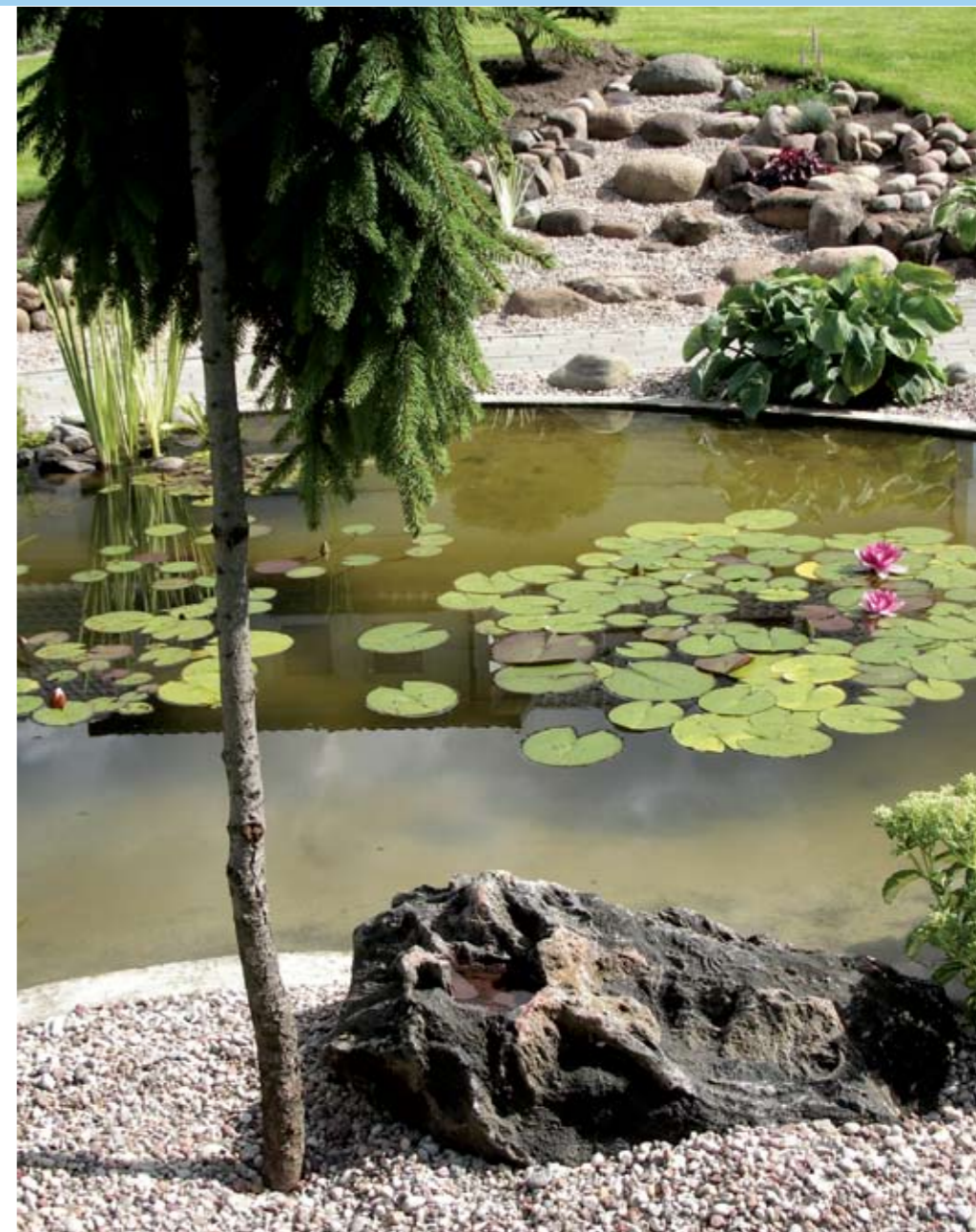
Akcentas – tai ašis, prie kurios šliejasi kiti sodo elementai

Įėjimus išryškinkite, akcentuokite augalais – čia puikiai tinka simetrija