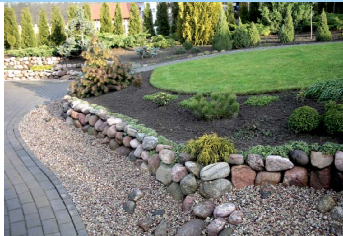
Atraminė sienelė turi atitikti pasirinktą stilių

dalį galima apželdinti žydinčiais, pavėsį mėgstančiais augalais.