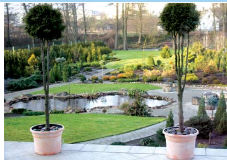
Siaurame pailgame sklype viena už kitos išdėstomos atskiros aikštelės (zonos) – tai vizualiai praplatina sklypą

Tuomet bus juntama stiliaus, spalvų, formų vienovė tiek viduje, tiek išorėje, t. y. prie pasirinkto stiliaus derės ne tik baldai, šviestuvai ar gėlių vazonos, bet ir grindų bei sodo takų dangos, terasa, tvora, vartai, vandens telkiniai, augmenija.