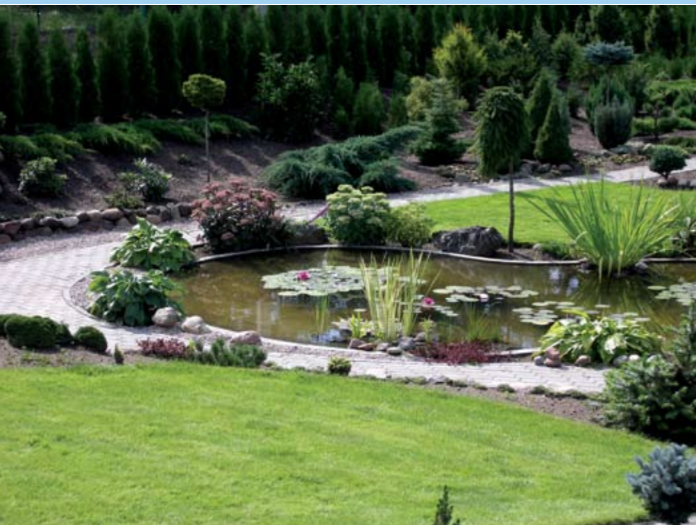
Dekoratyviniai augalai, vandens telkinys, takas – tai pagrindiniai aplinkos komponavimo elementai